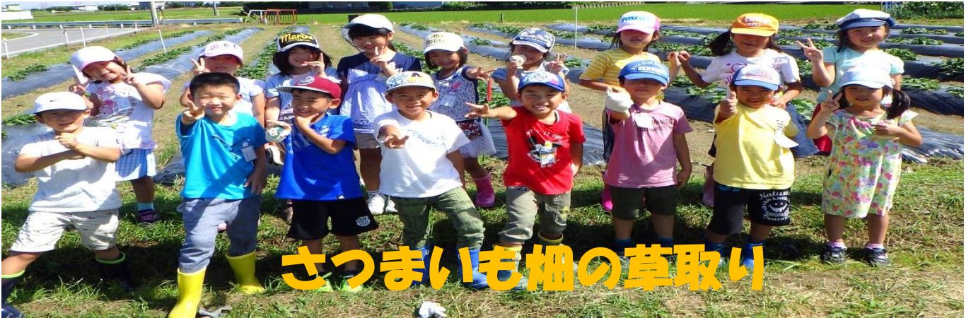
さつまいも畑の草取り

早いもので、1学期も最後の月になりました。「初めて」がいっぱいで緊張していた子どもたちもずいぶん慣れて、たくさんの笑顔を見られるようになってきました。学習内容もひらがなやたしざんなど、すべての学習の基礎になることを学んでいます。初めての長期休業に向けて、基礎を定着させながら、あと1か月何事にも精一杯取り組ませていきたいと思います。